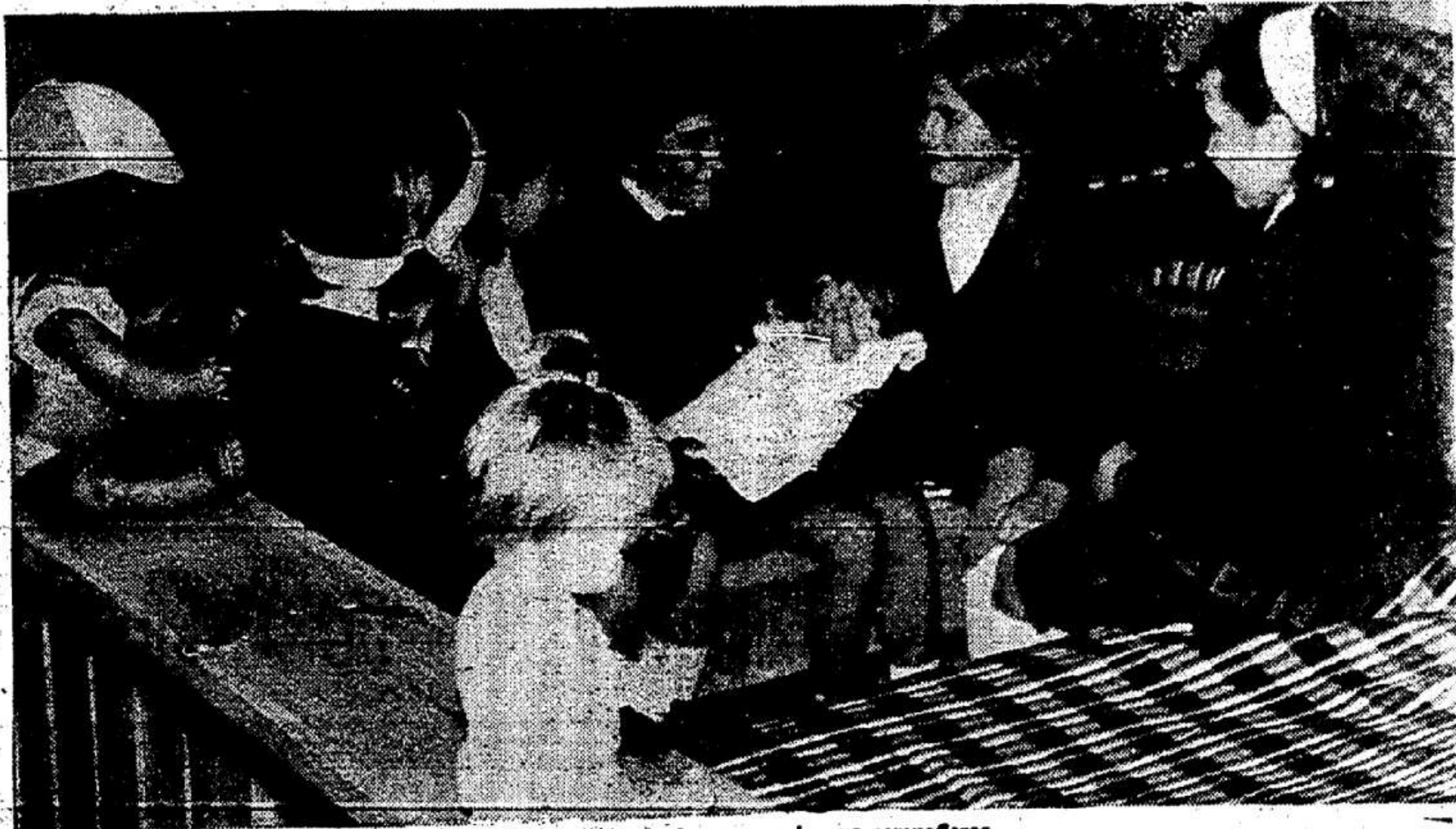
En la habitación, con las que serán sus compañeras.